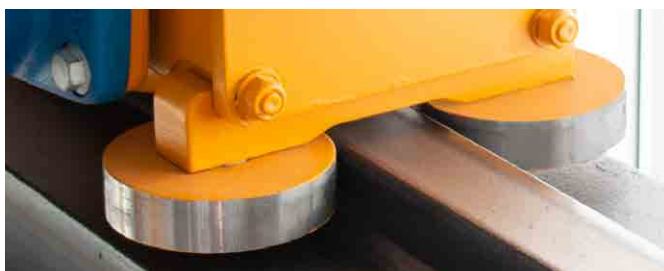
Galets de guidage sur le chemin de roulement supérieur